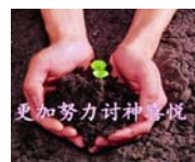
更加努力討神喜悅

■ 當然，因為前提是我們願意照著祂的心意行、我們願意討祂的喜悅， 我們有這樣的心志，我們求問神的心意，祂一定會告訴我們的