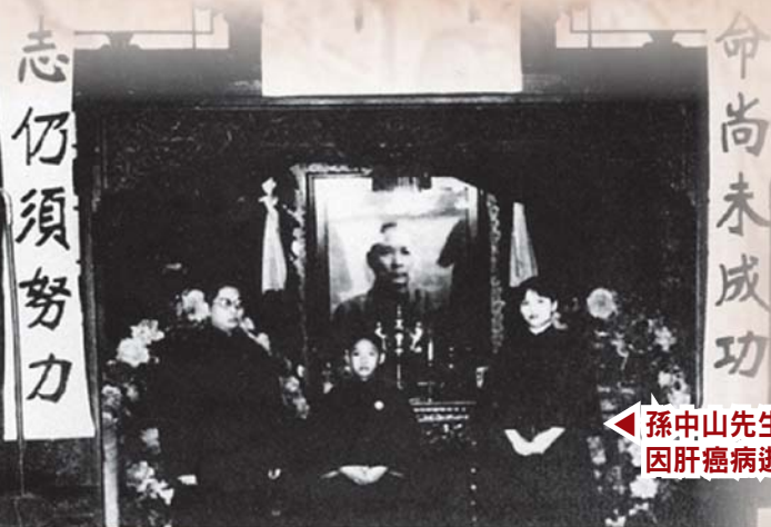
◀ 孫中山先生於1925年3月12日 因肝癌病逝於北京。