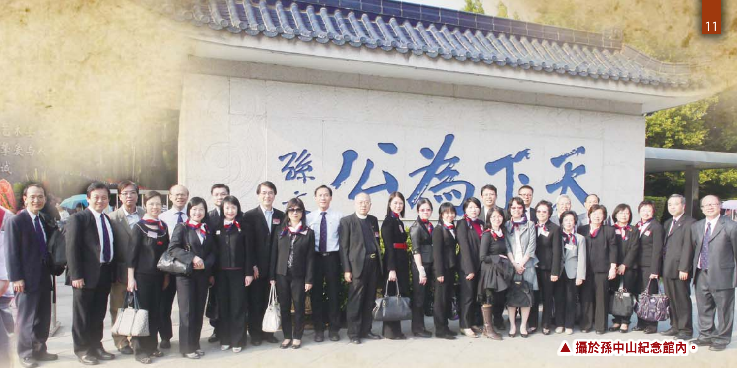
▲ 攝於孫中山紀念館內。