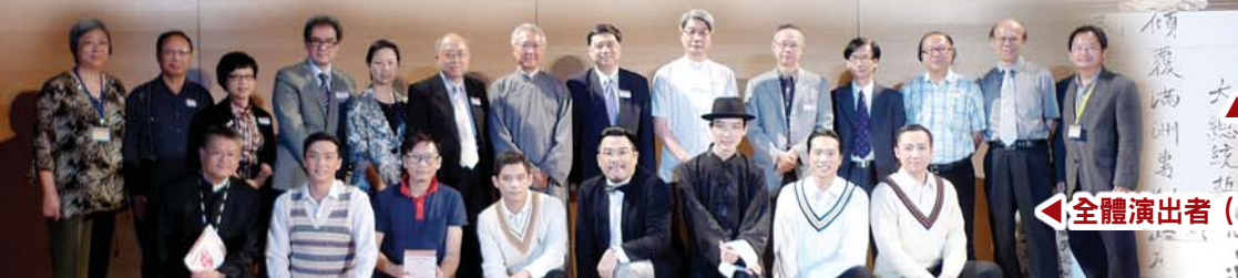
◀全體演出者（前排）與本會成員合照。