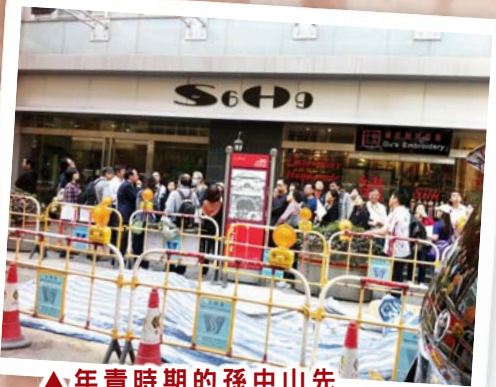
▲年青時期的孫中山先生，常到原址位於荷李活道的道濟會堂聚會，現該處已成繁忙的鬧市。