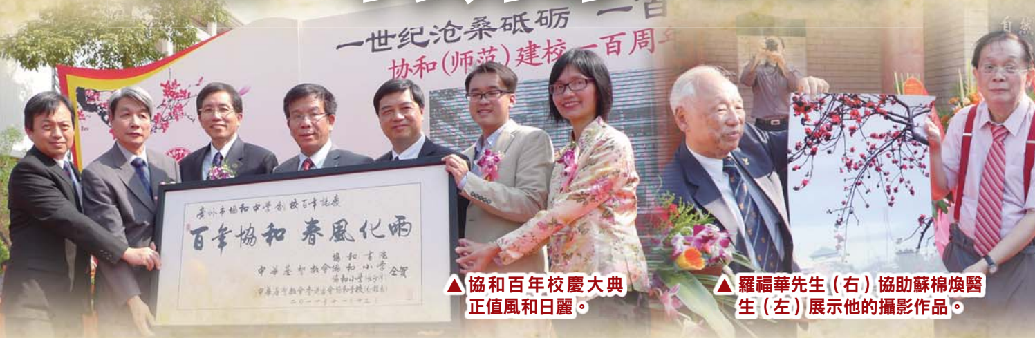
▲協和百年校慶大典 正值風和日麗。