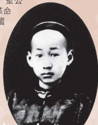
孫中山先生帶領鄉間好友陸皓東受洗加入公理堂及投身革命，陸氏更在乙未之役事件中，成為首位為革命犧牲的烈士。

民政府財政事務的李煜堂（即港產電影「十月圍城」中角色李玉堂的原型），及其子李自重，並女婿馮自由，都屬「公理堂」。李自重、馮自由及王寵惠等人，更曾被孫先生差派到港，組織「興中會香港分會」，聯絡及招攬革命志士（包括李樹芬醫生，也是經由李自重引薦下加入革命黨，及後成為孫先生的醫事顧問），和出版革命喉舌《中國日報》。