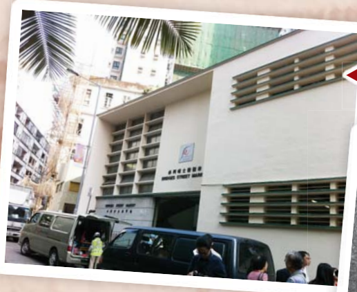
◀孫中山先生接受洗禮的會堂原址今昔面貌。▼